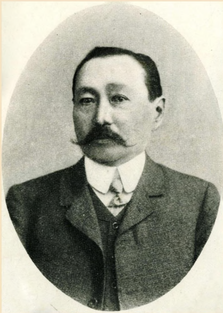
Найон-Тундутов Д.Ш. – депутат Государственной Думы, избранный от кочевых племен Астраханской и Ставропольской губернии, землевладелец. 1906 год.