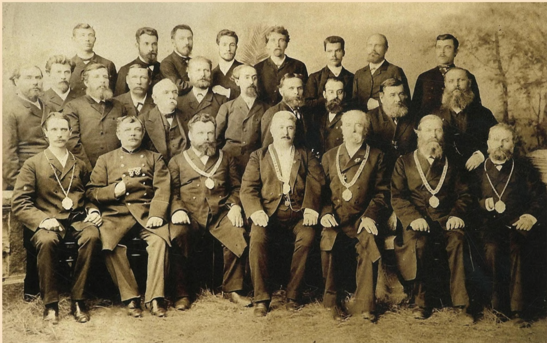
Члены городской управы. Начало XX века.