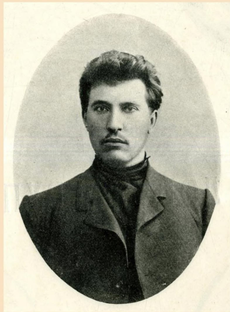
Онипко Ф.М. – депутат Государственной Думы, избранный крестьянской курией, редактор газеты «Трудовая Россия». 1906 год.

Государственный архив Ставропольского края. НСБ. Инв.№2209, с.52.