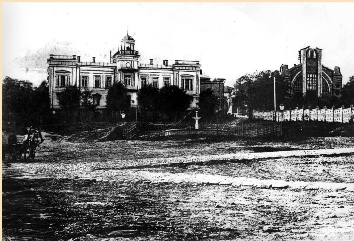
Здание Ставропольской городской Думы. Начало XX века.

Дума занимала небольшое каменное строение у южного склона Крепостной горы. Строение было тесным, поэтому буквально рядом с ним в 1847 году началось сооружение нового здания Думы по проекту известного Ставропольского архитектора Петра Славянского. Проект был утвержден кавказским наместником, князем Михаилом Семеновичем Воронцовым. Деньги на строительство пожертвовал купец первой гильдии Иван Ганиловский. К началу 1850 года здание было окончательно сооружено.